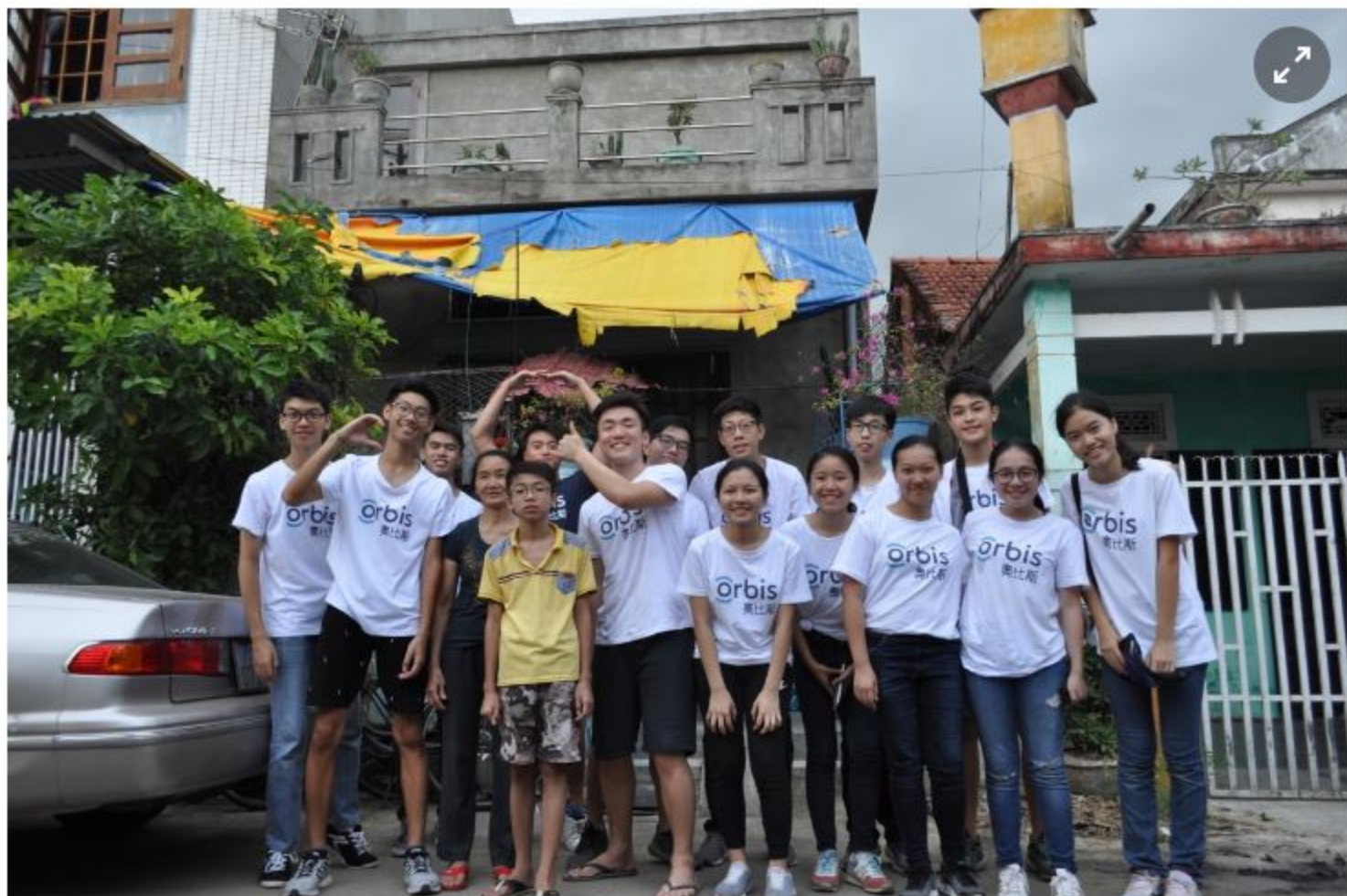
奧比斯在8月舉辦海外救盲體驗團，13名高中生及大專院校學生出發到越南，了解當地的救盲情況。